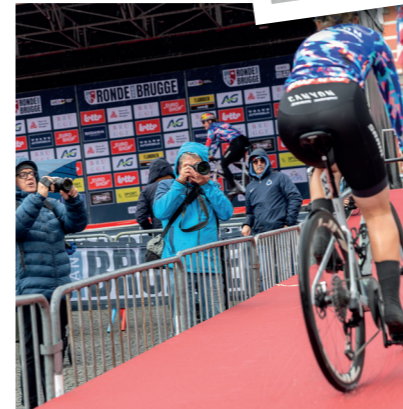
Cursus Actie en beweging