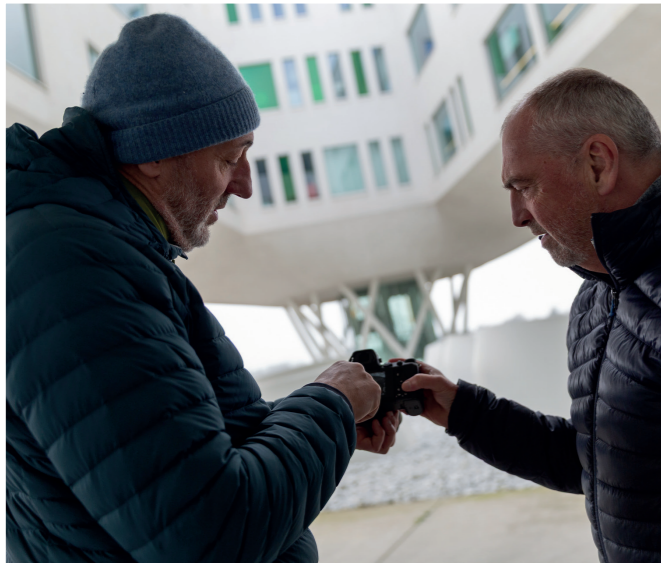
Cursus Landschap en Ruimte

Te veel soorten om op te sommen en elk ervan vereist specifieke instellingen zoals sluitertijd, diafragma, lichtgevoeligheid. Bovendien zijn er ook andere aandachtspunten waarmee je rekening moet houden zoals bijvoorbeeld compositie, gebruik van objectieven, kalibratie, afwerking en nog veel meer.