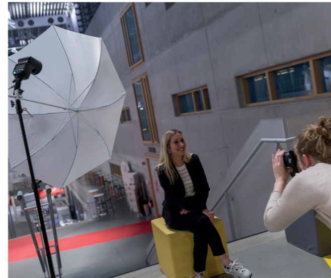
Cursus Mens en Portret

Onze professionele lesgevers maken je wegwijs in de wereld van de fotografie en geven je talloze tips voor een betere foto. De cursussen zijn praktijkgericht. Je krijgt tal van oefeningen zowel op verplaatsing als in een van onze volledig ingerichte fotostudio's.